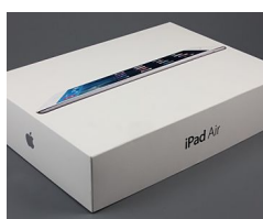
Perche' pagare di piu? Con questo nuovo sistema si risparmia fino al 90% sull...