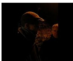
Il procuratore Amato: "Lo stiamo cercando, era già agli arresti domiciliari"