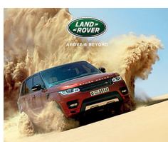
RANGE ROVER SPORT PRENOTA UN TEST DRIVE