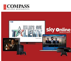
Prestito personale con intrattenimento incluso >> scopri di più