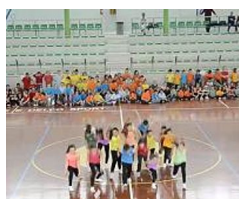
Olimpiadi della Danza, che spettacolo a Rovereto